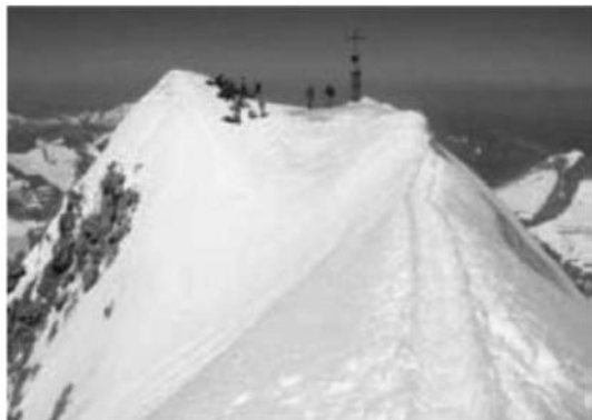
La croce del monte Grossvenediger